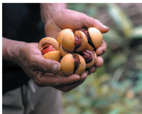
Vers geplukte nootmuskaat in Indonesië.